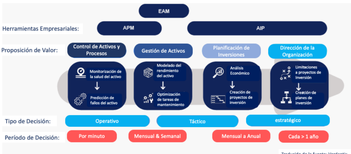
Figura 2. Visión de Verdantix de las soluciones de software EAM, APM y AIP [2]

No debemos confundir APM con AIP, el APM está diseñado para apoyar la operación segura, fiable y eficiente de los equipos y la infraestructura, mientras que AIP está diseñado para apoyar las decisiones de inversión de capital a corto y largo plazo. Véase la visión de Verdantix de los tres tipos de sistemas en la Figura 3 [2].